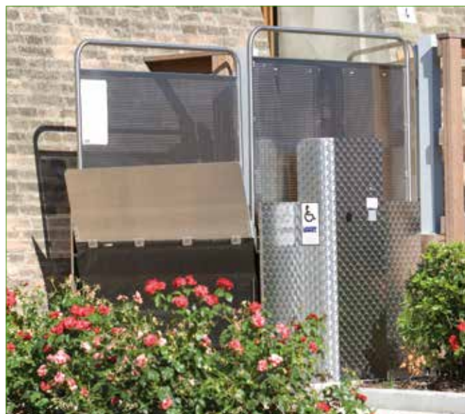
Versión de acero inoxidable (opcional)