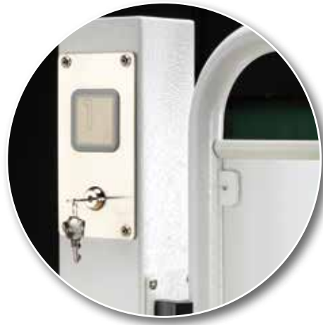
Botonera de piso