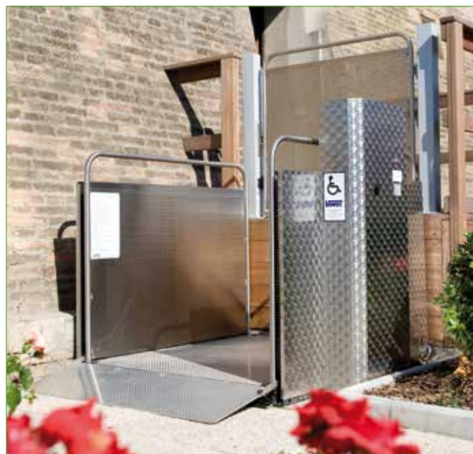
Versión de acero inoxidable (opcional)