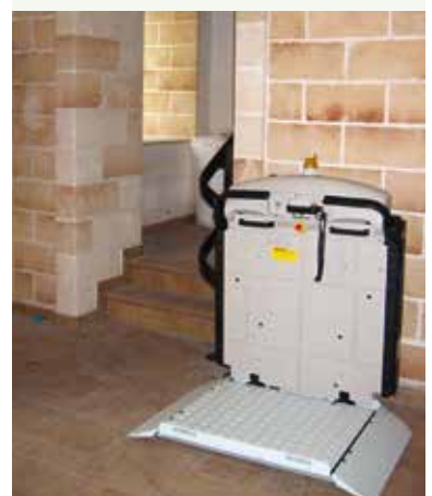
V65 con barras retráctiles

con plataforma decididamente amplia, para toda necesidad de desplazamiento.