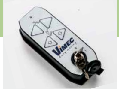
Mando via radio