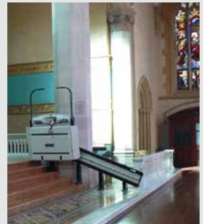
V64 con apertura automatizada